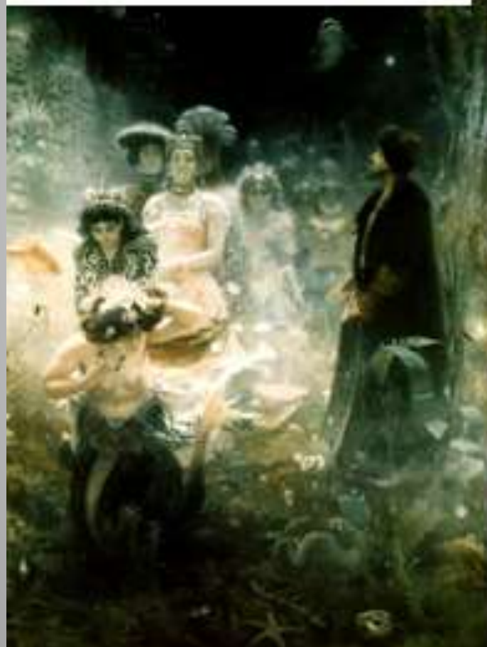
И. Репин «Садко» (1876)