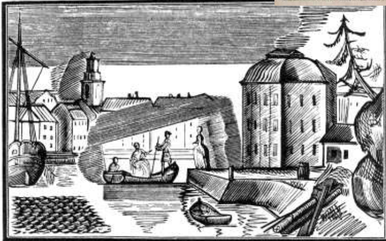
В. Фаворский. Гравюра иллюстрация к роману П. Муратова «Эгерия»(1921)