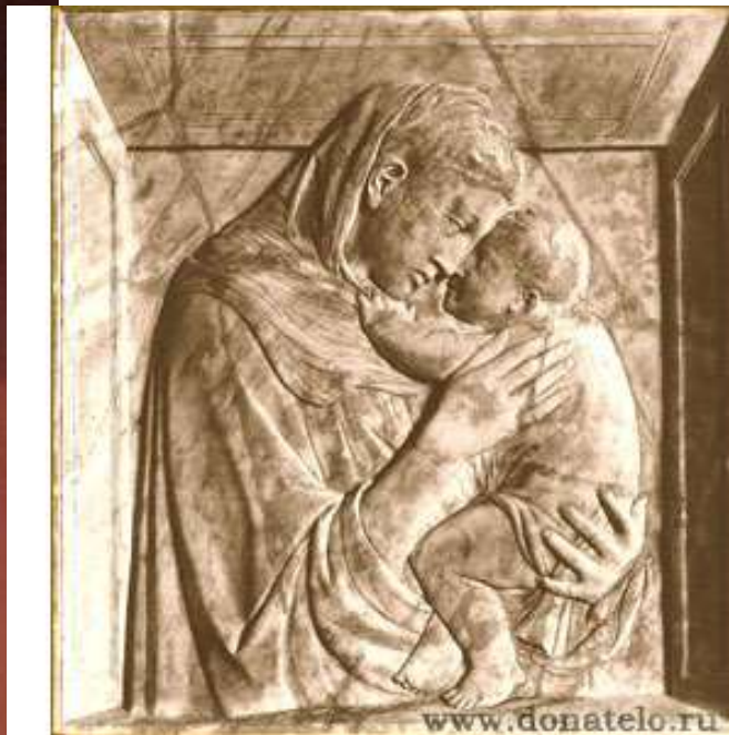
Донателло Мраморный рельеф «Мадонна Пацци» (1422)