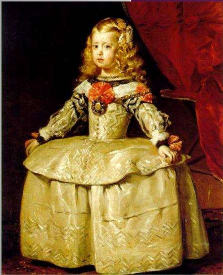
Веласкес. «Портрет инфанты Маргариты». Масло(1654)