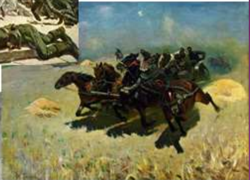
М. Греков «Тачанки» (1925)