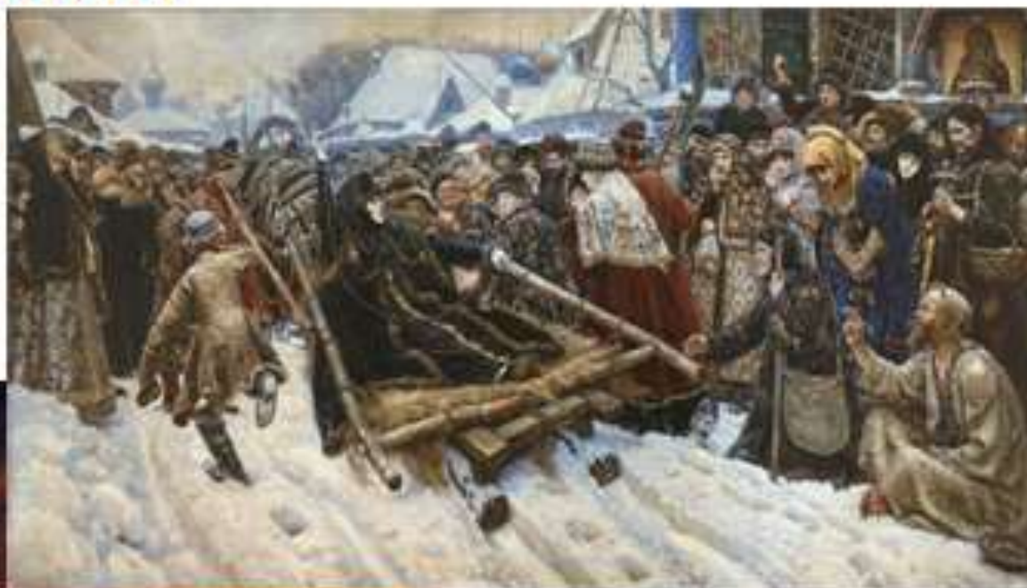
К. Брюллов «Последний день Помпеи» (1830)