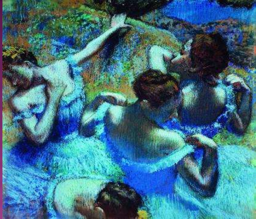
Э. Дегга. «Голубые танцовщицы». Пастель(1865)