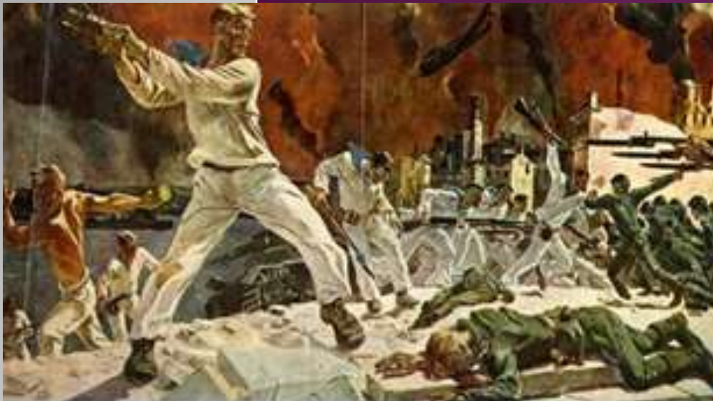
А. Дейнека «Оборона Севастополя» (1942)